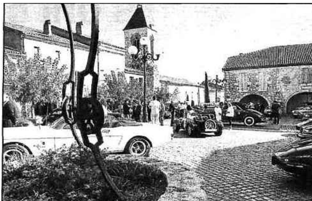
Du beau monde sur la place