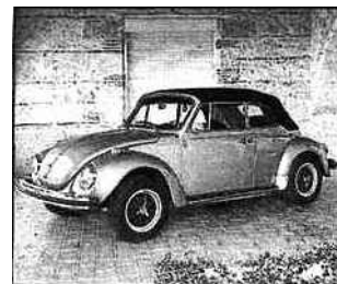
Une bonne vieille coccinelle